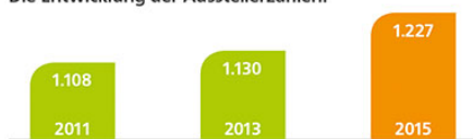
Die Entwicklung der Ausstellerzahlen: